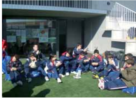
Alevíns na Arousa Cup