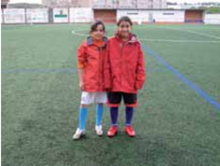
As nosas rapazas