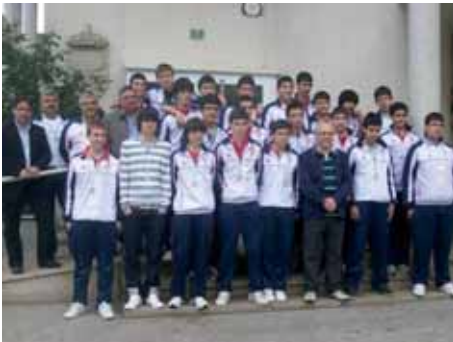
Recepción no concello ao equipo cadete campión de liga