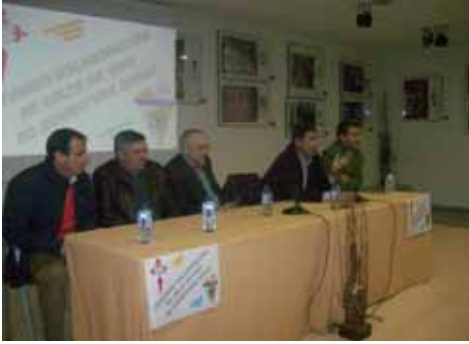
Presentación Campus do R.C. Celta de Vigo