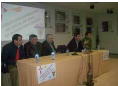
Firma do convenio de colaboración co Celta de Vigo