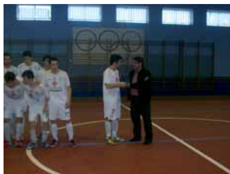
Partido fronte ó Lobelle